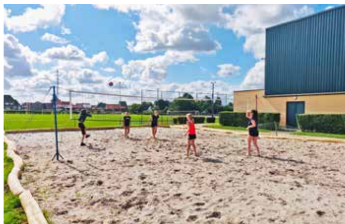
Volleybalclub NVV Tienen