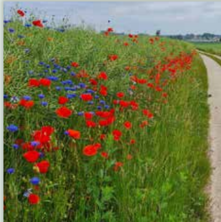
6 JUNI @Jfdeclercq: #thuisintienen

Gebruik #thuisintienen voor al je Instagramfoto's over Tienen: de kans bestaat dat jouw foto in deze rubriek terechtkomt!