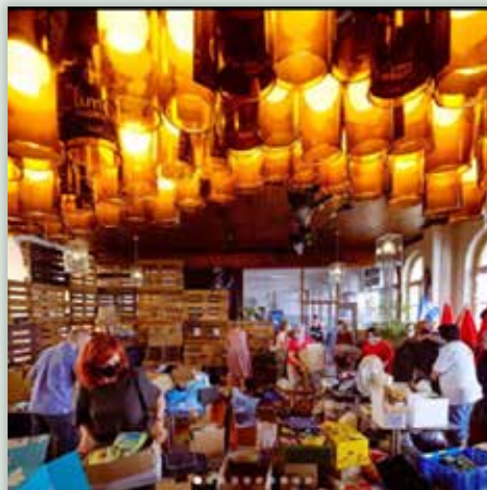
17 JULI @philippevdp: Tienen #solidairestad #thuisintienen #opgewekTienen #Pand10