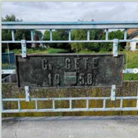
4 JULI @de_hondenprofessor: Geen speelvriendjes op de losloopweide, dus even de buurt verkend. #thuisintienen #hondentraining #puppytraining #Tienen #rivier #wateroverlast #water #dogwalker #honden #hondenprofessor