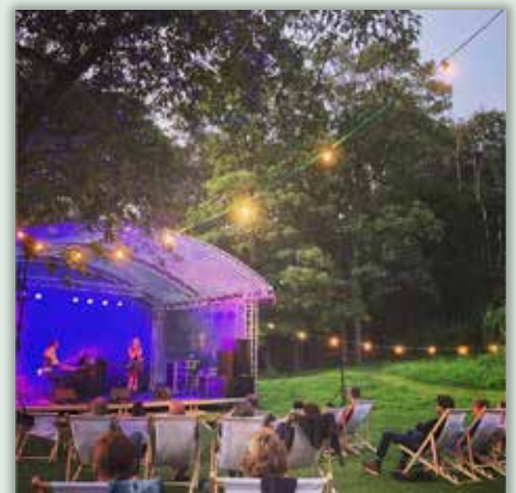
15 AUGUSTUS @myriammettes #zomerentienen #thuisintienen #viandra #bonnieencyde #genietenineenmooieomgeving #mooioptreden