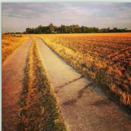
24 JULI @nico.peeters.712: Wandering ... #tienen #thuisintienen #3300tienen #vrtweer #landscape #landschapsfotografie #picoftheday #vtmweer