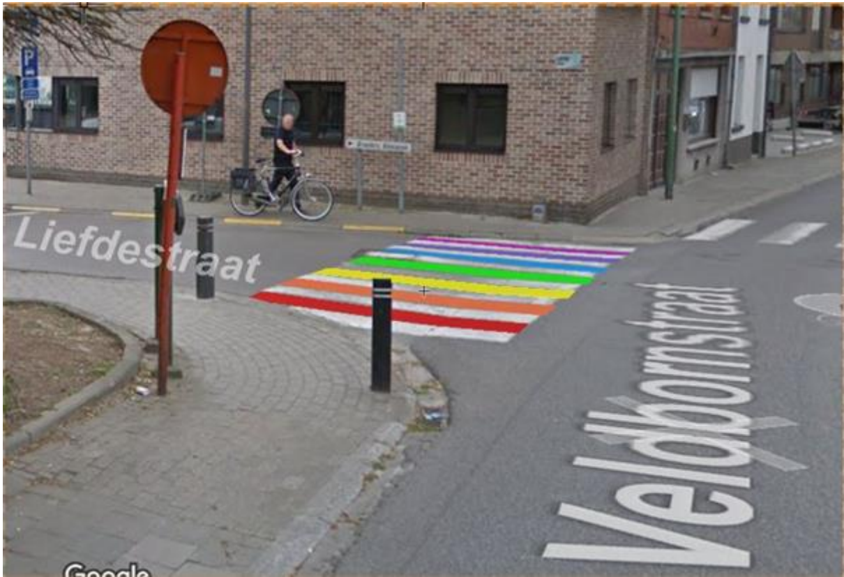
Namens de Groen-fractie, 19/03/2021