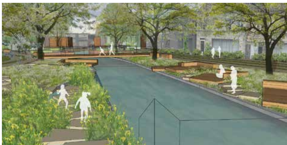
Ontwerp: Studiebureau Pauwels